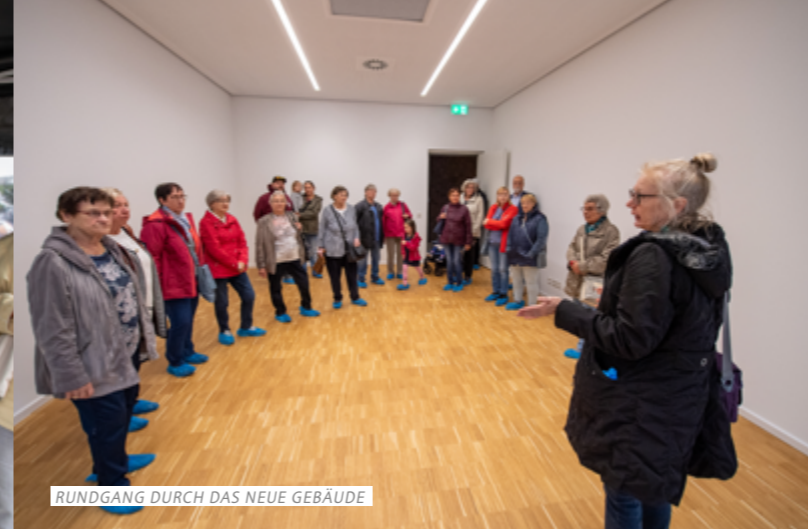
RUNDGANG DURCH DAS NEUE GEBÄUDE