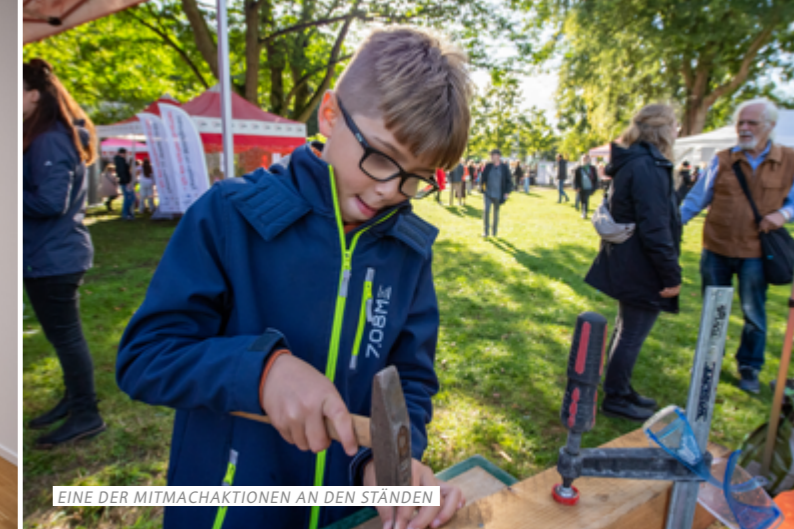
EINE DER MITMACHAKTIONEN AN DEN STÄNDEN