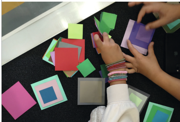
Workshop Josef Albers 2022