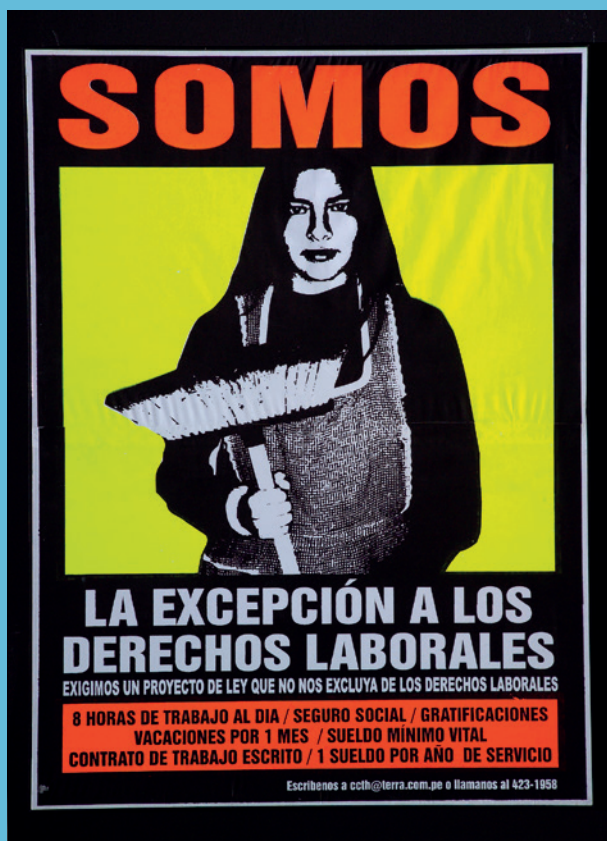
Natalia Iguñiz, Somos la excepción de los derechos laborales (Wir sind die Ausnahme von den Arbeitsrechten), 2002, Poster, Siebdruck