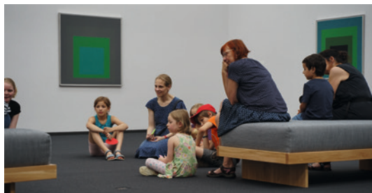
Familienführung Josef Albers, 2023