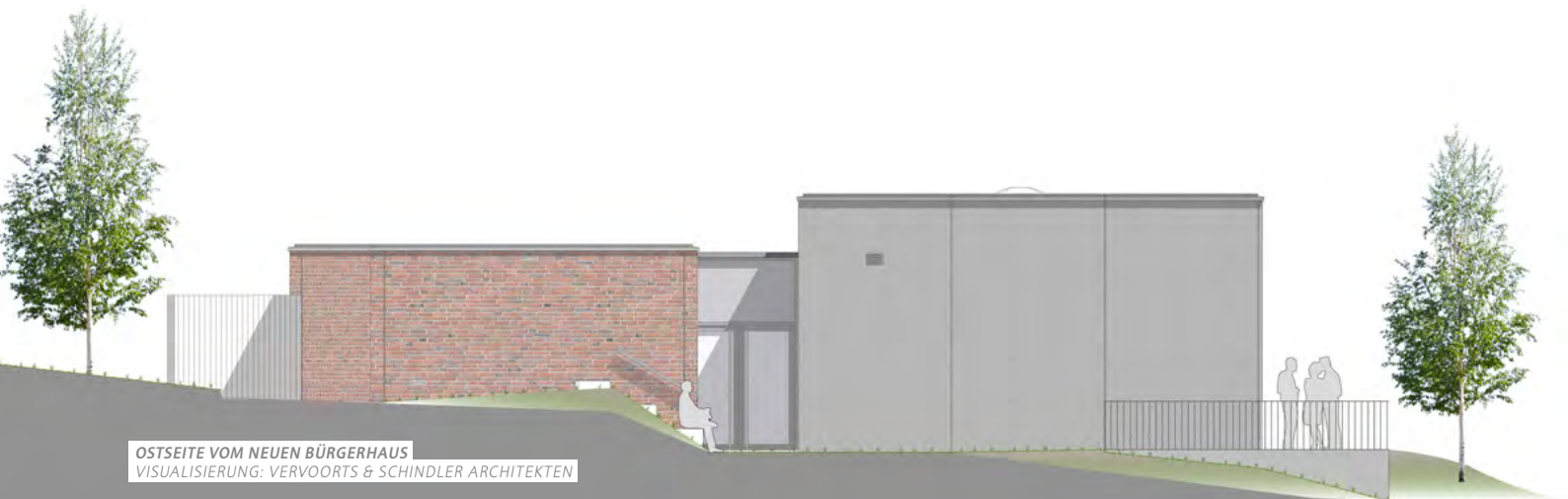
OSTSEITE VOM NEUEN BÜRGERHAUS VISUALISIERUNG: VERVOORTS & SCHINDLER ARCHITEKTEN

Neben Büroräumen für die Hausverwaltung und einem Sitzungsraum bietet ein großer (teilbarer) Multifunktionsraum Platz für Kursangebote und den zukünftigen Cafébetrieb, der in den Sommermonaten auf die neue Terrasse, mit Blick Richtung Park, erweitert werden kann. Eine kleine Küche erlaubt das Angebot von Kaffee und Kuchen.