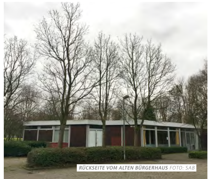
RÜCKSEITE VOM ALTEN BÜRGERHAUS

Das Bürgerhaus Batenbrock ist mit seiner zentralen Lage im Quartier ein bekannter Begegnungsort für die Bürger*innen im Stadtteil. Das derzeitige Gebäude ist in die Jahre gekommen und entspricht nicht mehr den Anforderungen eines modernen Treffpunktes für vielfältige Bevölkerungsgruppen. Mit dem Neubau wird ein für den Stadtteil wichtiger Ort der Begegnung gestärkt. Das neue Bürgerhaus soll ein generationsübergreifender Ort des Austauschs, des Begegnens und (Kennen-) Lernens werden, in dem zukünftig beratungs- und freizeitorientierte Angebote stattfinden werden. Auf diese Weise wird eine Anlaufstelle im Quartier mit vielfältigen Teilhabemöglichkeiten geschaffen, die aufgrund ihrer Lage auch der Belebung des Volksparks Batenbrock dient.