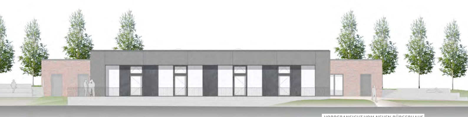
VORDERANSICHT VOM NEUEN BÜRGERHAUS VISUALISIERUNG: VERVOORTS & SCHINDLER ARCHITEKTEN