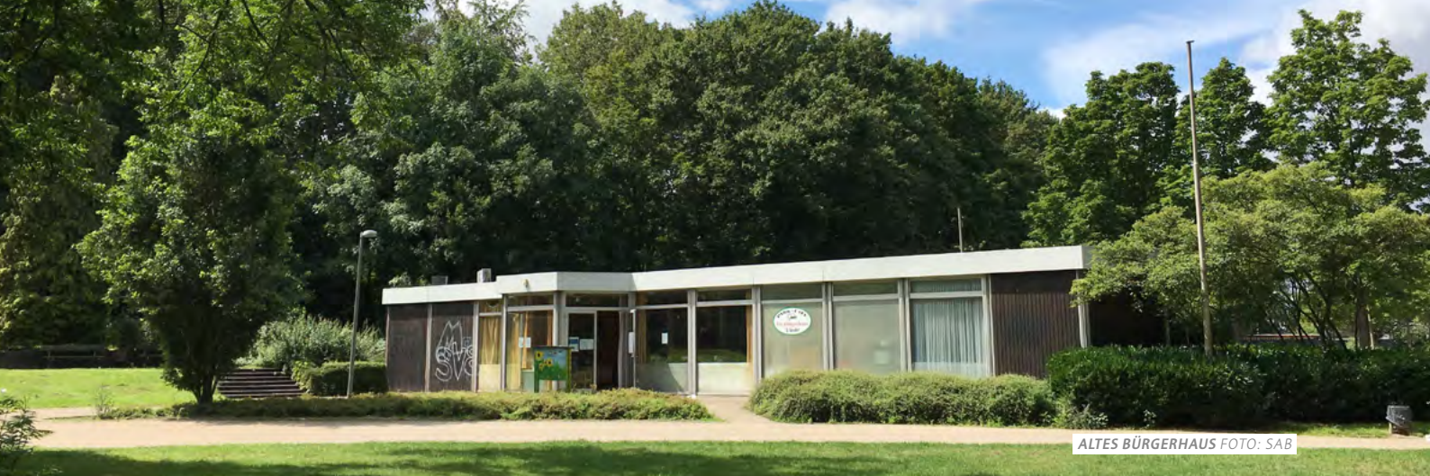
ALTES BÜRGERHAUS