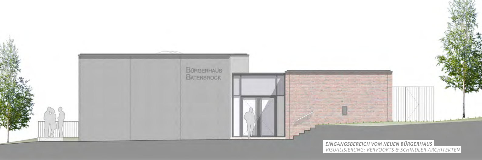
EINGANGSBEREICH VOM NEUEN BÜRGERHAUS VISUALISIERUNG: VERVOORTS & SCHINDLER ARCHITEKTEN